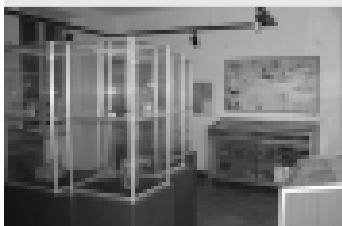
Museo Perrando. "Sezione storia naturale - fossili"

tel. - fax - segr. tel. 019724100 orario (chiuso da novembre a marzo) GIOVEDÌ-VENERDÌ-DOMENICA dalle 16 alle 18 info@sasselloweb.it www.sasselloweb.it