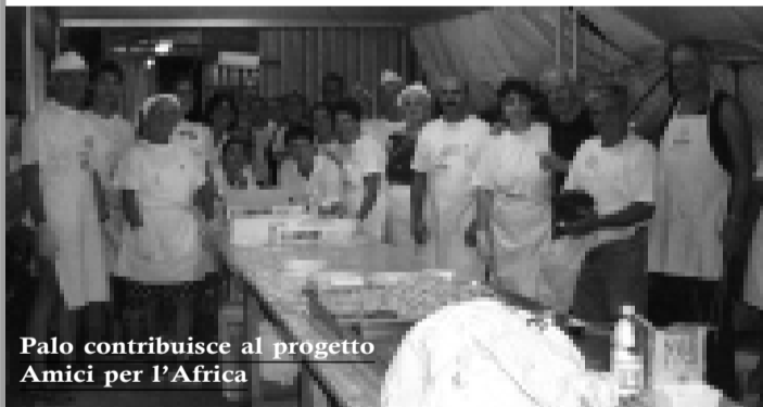
Palo contribuisce al progetto Amici per l'Africa

Che bella notizia. La sciolta associazione "Insieme per Palo" dona il fondo cassa finale (circa 5.000 euro) al progetto degli Amici del Sassello che sta costruendo nuove strutture ai bambini africani di Irambo in Congo